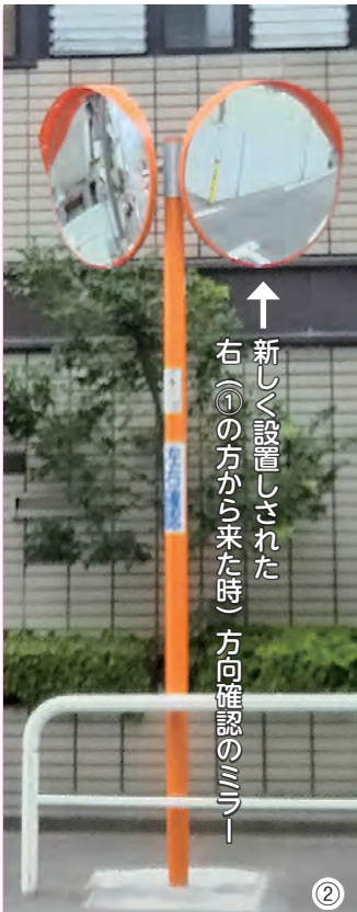
↑ 新しく設置しされた 右(①の方から来た時)方向確認のミラー

今号の内容 ■町会長あいさつ / 大山西町町会の要望に応えていただきました / 健康を考える / 大山パークフロント(東京建物)と大山西町町会との関わりについて / にしまちNEWSFLASH! / 西町アイリス / CAPS 弥生児童館 / カンタンクッキング