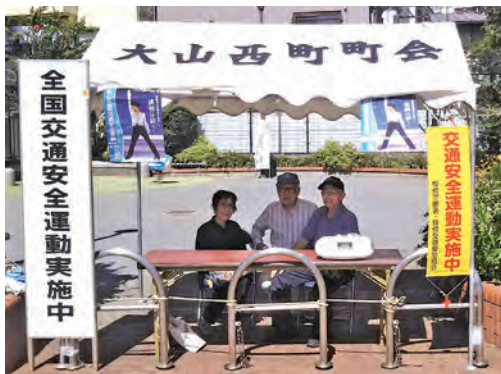
西寿会のみなさん

秋の全国交通安全運動が行われました。大山西町町会は西寿会と協力して交通安全の啓蒙活動を実施し、交通事故防止に努めました。