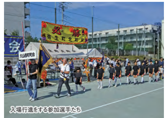
入場行進をする参加選手たち