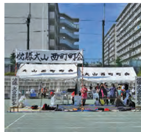
大山西町町会のテント準備風景

仲町地区運動会が行われました。晴天の中、西町町会は120人ほどの参加者がいろいろな競技に挑みました。最後のリレーでは各町会の大きな声援が響いていました。楽しい秋の一日を過ごすことができました。