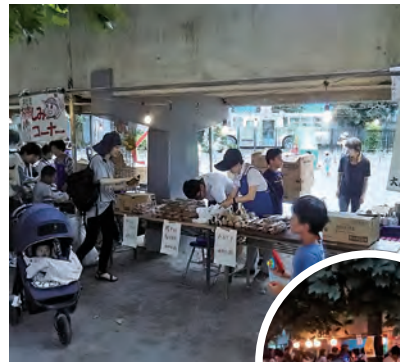
前日が雨だったため、この日は午後3時から子どもコーナーを開始しました

納涼盆踊り大会が開催されました。初日は大雨に見舞われましたが、2日目には大勢の参加者を迎えることができました。踊りの輪も広がり、子どもコーナーや模擬店も大盛況でした。