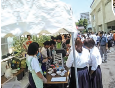
当町会担当のコーナーで中学生と一緒に