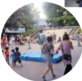
本年は台風の影響でやぐらが組めませんでしたがパレットの上での太鼓も頑張りました