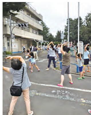
交通公園管理棟前で行われたラジオ体操

7月21日(土)~27日(金) 交通公園においてラジオ体操が行われました。近隣からの参加もあり、毎日たくさんの掛け声が響きました。暑さの中でも一日の始まりはラジオ体操が一番です。