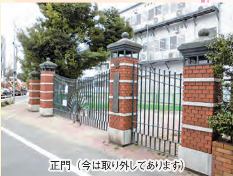
正門（今は取り外してあります）

第十小学校が改築され素晴らしい学校に変わっていくことは、卒業生としても地域住民としてもたのしみになります。