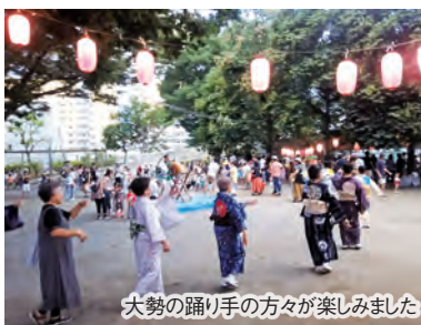
大勢の踊り手の方々が楽しめました