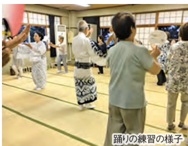
踊りの練習の様子

恒例の納涼盆踊り大会が交通公園において行われました。あいにくの大型台風到来でやぐらの設置ができず、また28日(土)は中止となってしまいましたが、1日だけの大会でも大勢の参加者で賑わい、踊りの輪も大きく二重になり、2日分の想いを楽しみました。7月25日(水)、26日(木)に行われた踊りの練習には大勢のご参加をいただきました。猛暑の中の熱心な練習の成果を発揮できて本当に良かったです。