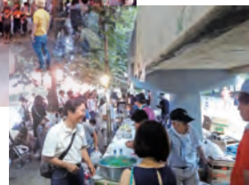
売店担当者も大忙し