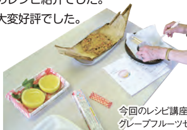
今回のレシピ講座 グレープフルーツゼリーとおこわ