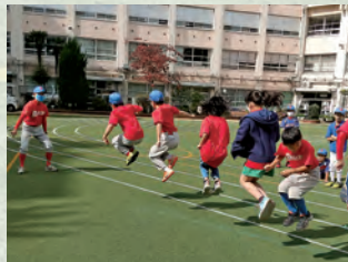
2チームに分かれて大縄跳び