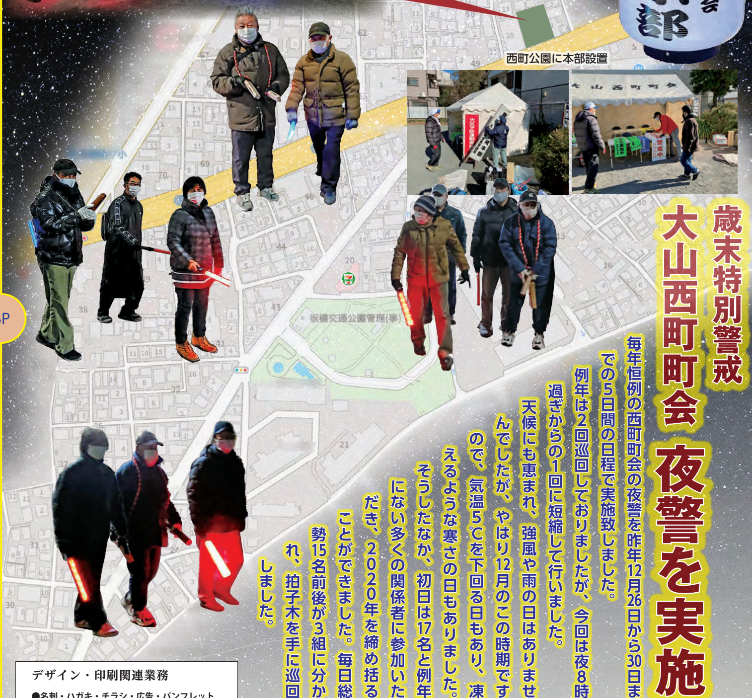
西町公園に本部設置