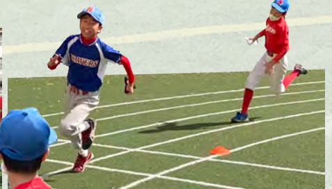
接戦だった対抗リレー