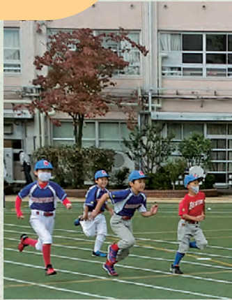
全力疾走した徒競走