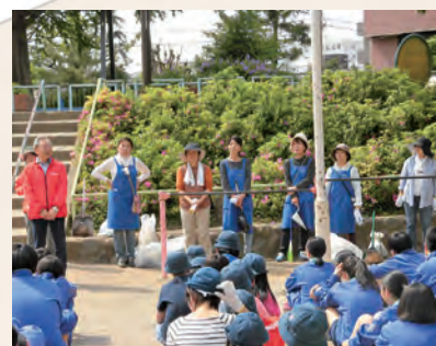
板橋二中の生徒と公園周辺クリーン作戦 (2019年5月)