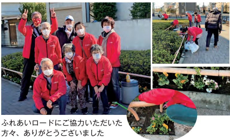
ふれあいロードにご協力いただいた方々、ありがとうございました

昨春秋にたくさんさんのチューリップの球根を植えました。春の綺麗な花壇が楽しみです。