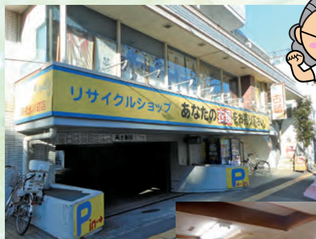
キングファミリー板橋氷川店(外観)