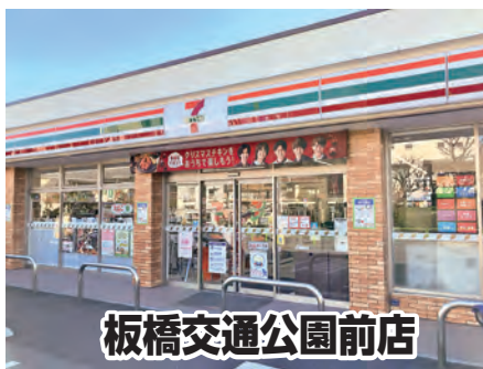
板橋交通公園前店