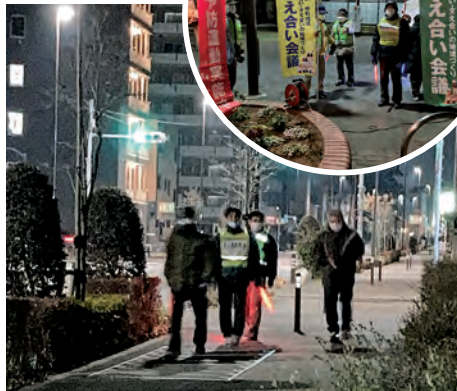
地域内を巡回しているみなさん