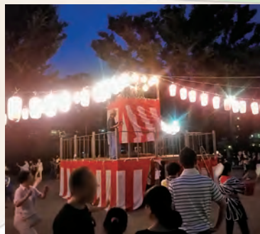
2019年7月に行われた 大山西町町会納涼盆踊り大会の様子