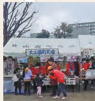
2019年3月に行われた 桜まつりの様子