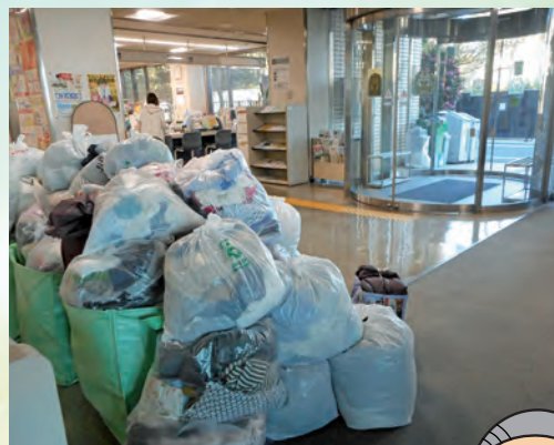
大谷口地域センターの回収場所