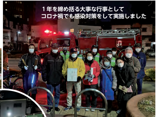
1年を締め括る大事な行事として コロナ禍でも感染対策をして実施しました

12月26日から30日の5日間、大山西町町会有志による歳末夜警が実施されました。町内を巡回し、防火・防災を呼びかける声がみなさんに届きましたでしょうか。家の周辺には燃えやすい物を置かない、戸締りはしっかりとしましょう。一人ひとりの心がけが事件・事故を未然に防ぐことにつながります。