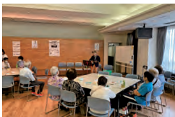
エレクトリックマンドリン演奏