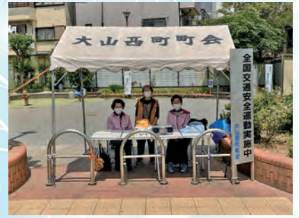
2023年春の全国交通安全運動中の見守り