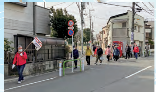
防災訓練。避難誘導