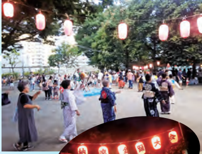
2018年の納涼盆踊りの様子 今年は4年ぶりに盆踊りを開催の 予定です