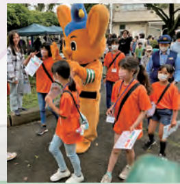
ピーポーくんを誘導するジュニアリーダー