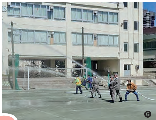
② 集団避難行動訓練 ⑥ 区民消化隊による放水訓練