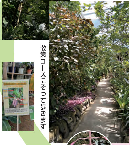
散策コースにそって歩きます