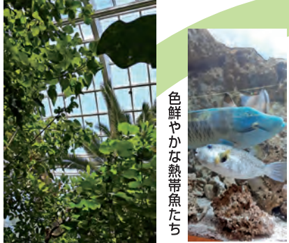
色鮮やかな熱帯魚たち

温室は板橋清掃工場の余熱を利用。ゴミ焼却の際に出る高温の排ガスから温水を作り、高島平温水プール、高島平ふれあい館、都立板橋特別支援学校でも活用されています(「熱帯環境植物館」パンフレットより)