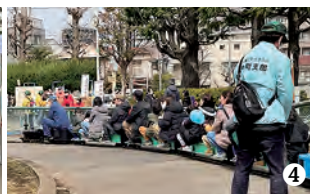
①② 模擬店風景 ③ ピーポーくん出動 (板橋警察署協力) ④ ミニSL列車 ⑤ 会場風景 ⑥ 2024年3月板橋区内の桜