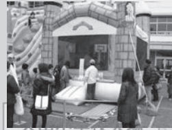
プリンセスキャッスルトランポリン