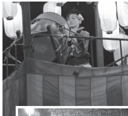
パチさばきも鮮やか！