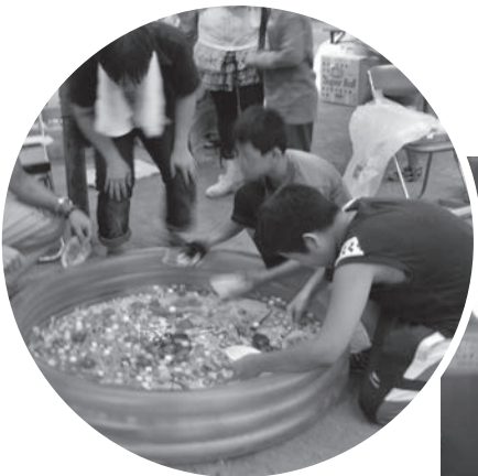
子供たちに人気のスーパーボールすくい