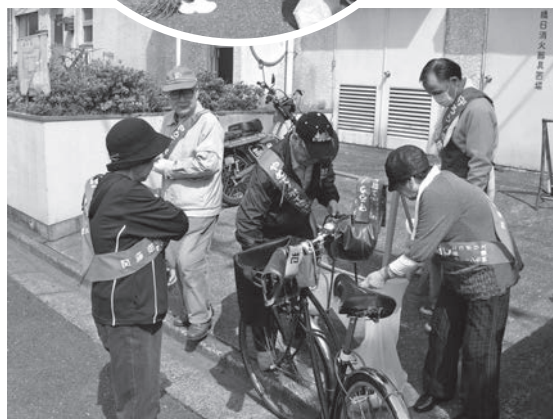
キレイになって気持ちがいいですね！