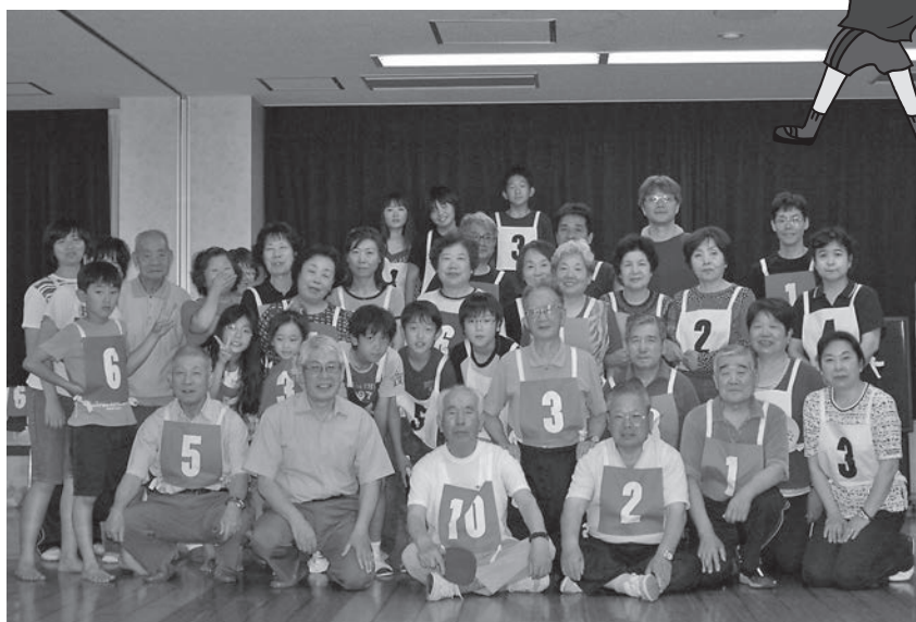
終了後に参加者で記念撮影

6月20日(日)に第2回西町スポーツ大会「ピンポン大会」が開催(前はソフトボール)され、大変な盛況でした!