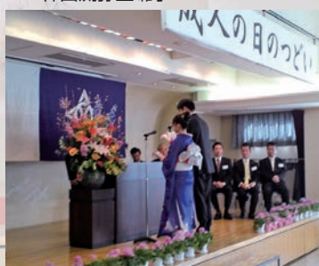
お礼のごとば新成人の代表お二人