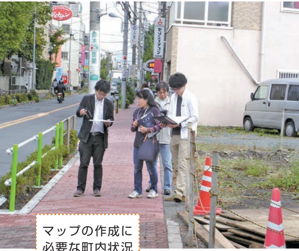
マップの作成に 必要な町内状況 調査

は各家庭に配布された後、皆さんの 知識を追加し住民自信が町を点検し ながら、いつも新しい情報を載せて 利用価値のあるマップにしていく予 定です。