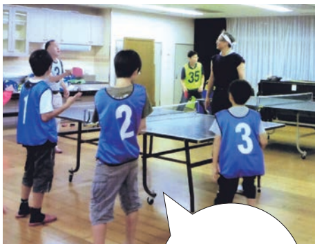
優勝した小学生チーム

9月23日(日)、仲町地域センターの卓球台のある施設で、第2回西町ピンポン大会を実施しました。第1回と同じルールでチーム対抗戦に汗を流しました。優勝は小学生チームでした。 みなさん笑いあり、悔し涙(?)ありのひとときでした。