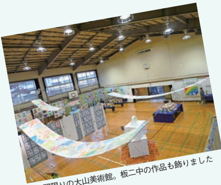
2日間限りの大山美術館。板二中の作品も飾りました

玄関から体育館までが子供たちの作品で飾られた大山美術館が出現しました。展覧会を2日間実施した中