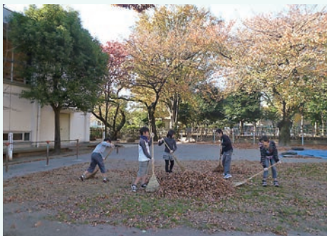
上学年は下学年に上手な掃き方を教えながら、みんなで頑張りました

庭で食べました。いつもと違った場所、穏やかな雰囲気の中での給食になりました。 ○兄弟学年・隣接学年活動 たくさんある本校の木々からの落ち葉を、隣接学年で協力して掃き集めました。