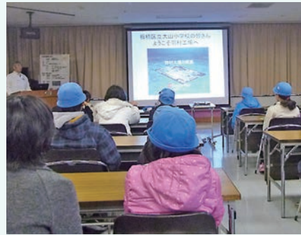
5年社会科見学 自動車の製作工程を学習しました

場で働くロボットやいくつも並ぶ醤油樽を見て、日本を支える産業を身近に理解することができました。