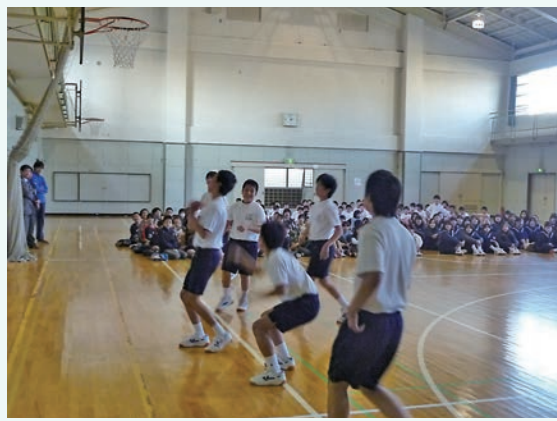
中学生の創作ダンスは、みんな真剣で格好良かったです

庭で食べました。いつもと違った場所、穏やかな雰囲気の中での給食になりました。 ○兄弟学年・隣接学年活動 たくさんある本校の木々からの落ち葉を、隣接学年で協力して掃き集めました。