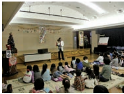
腹話術にくぎづけ

12月3日(土)、仲町地域センターにて青少年健全育成仲町地区委員会の主催によるお楽しみ子ども大会がおこなわれました。クリスマスがもうすぐのこの日に腹話術、パネルシアター、ゲーム大会と楽しい企画が盛りだくさん。参加してくれた子供たちも大喜びのひとときでした。最後にサンタさんからのプレゼントもありました。お手伝い下さったみなさん本当にありがとうございました。