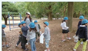
1・2年生生活科見学 ドングリをたくさん拾って秋を見付けました