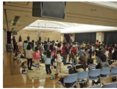
ジュニアリーダーによるゲーム大会に全員で参加