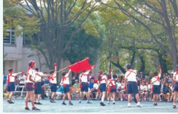
友達を、一生懸命に応援しました

晴天の下、運動会を行いました。短距離走・団体競技・表現運動と、子供たちは精いっぱい頑張りを発揮しました。そして、応援する大きな声が競技の頑張りを支えていました。