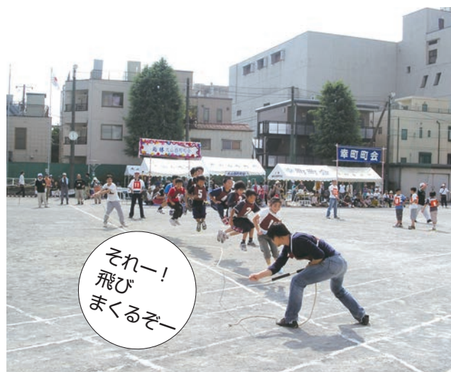
それー! 飛びまくるぞー