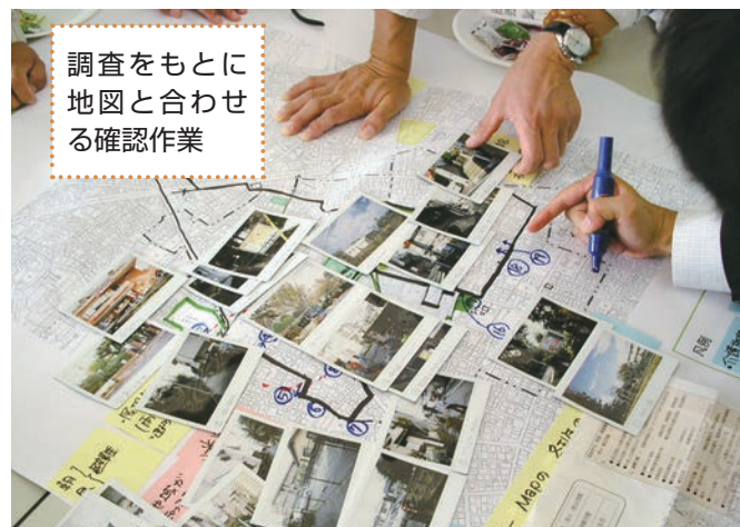
調査をもとに 地図と合わせ る確認作業

防火水槽や地域で使用できる貯水 槽を確認します。近隣の井戸の場所 を確認します。停電時でも手動で汲