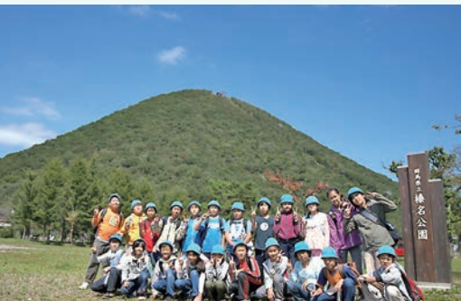
5年榛名移動教室 大自然の中で様々な体験学習を進めました

でも、多くの地域・保護者の皆様にご来校いただくことができました。有り難うございました。作品づくりは、今年度当初から始まりました。展覧会で多くの方に見ていただけることを励みに、制作が進むほどに膨らむイメージを楽しみながら作品を作りました。体育館の天井を飾ったのは、全校児童で作った共同作品です。