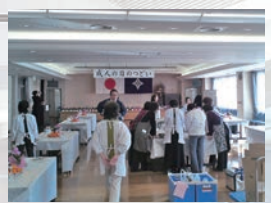
準備をする各町会の婦人部