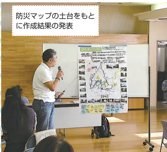
防災マップの土台をもとに作成結果の発表

備えあれば憂いなしです。皆さんで力を合わせ、住みやすく、安全な町作りに取り組みましょう。