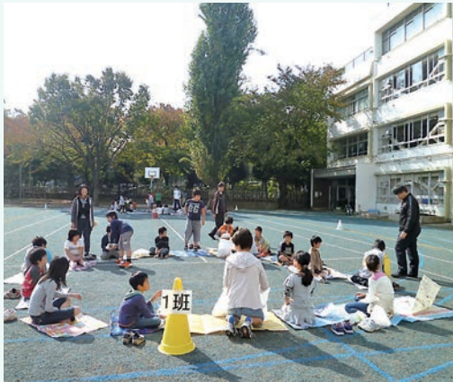
みんなで輪になって食べた給食は、とてもおいしかったです

今月のたてわり班活動は、お弁当給食でした。この日のメニューは、焼きそば・唐揚げ・ミカンでした。準備されたお弁当箱に入った給食を、たてわり班ごとに場所を決めて、校