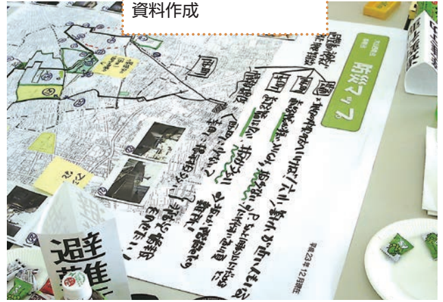
防災マップの土台となる資料作成

災無線・消防署・警察署などからの情報の伝達方法を確認します。掲示板・公衆電話の位置を知っておきます。飲料水や食料品、救援物資が確保できる施設を把握しておきます。公衆トイレ・仮設トイレ・公共施設のトイレ等の確認をします。災害時にも明かりが確保できる施設、ガソリンスタンド等を確認します。近隣の災害時要支援者（高齢者・障がい者）を把握しておきましょう。