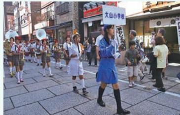
自分に自信をもって、パレードしました

それでも、堂々たる姿でパレードを進め、全てが終わった後にはとても晴れやかな表情を見せていました。