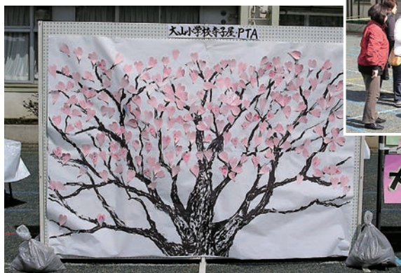
大山小学校寺子屋・PTAの咲かせよう! コーナー