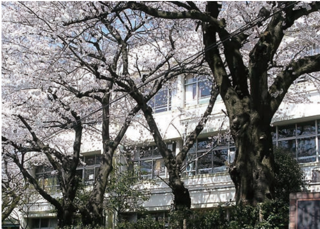
満開になった桜並木