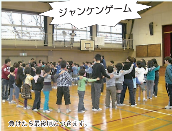
負けたら最後尾につきます。