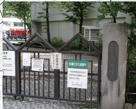
地域避難所指定の大山小学校