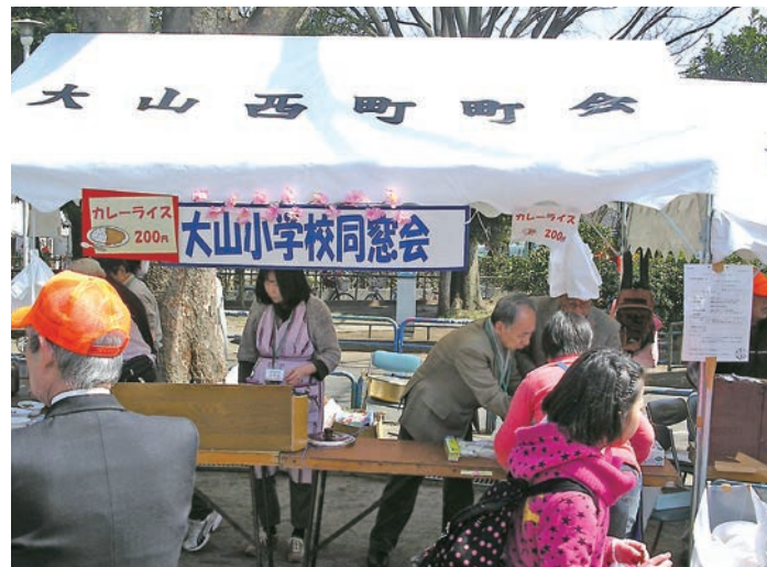
大山小学校同窓会のカレーコーナー

の衣装を制作しました。型紙から裁断・縫製・アイロンなどそれぞれ分業作業で、毎日授業終了時や空き時間を利用して3学年分の衣装を用意しました。今でも鼓笛パレードで目にするとは当時を思い出す方も多いのではないのでしょうか。思い出深い家庭科室です。今回の同窓会の桜まつり参加には、大山小学校をもっともっと元気にしたいという同窓生の思いから始まりました。私は大山小学校12期の卒業生です。同窓生として、また 娘のPTAとして大山小学校の存在の素晴らしさに触れてきました。最近では板橋区大山小学校学校防災計画にも加わり、大山小学校の位置や環境、設備など多方面にわたり充実している事を感じています。