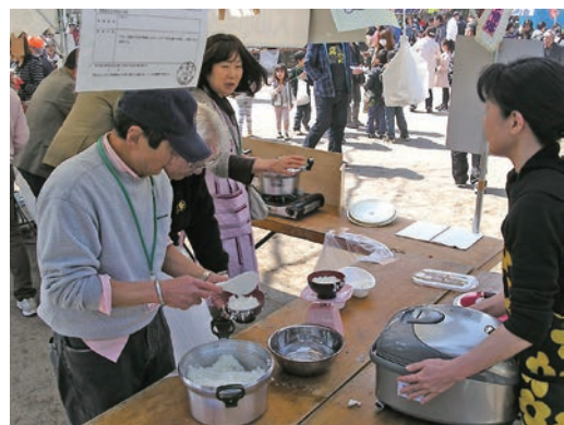
大忙しのメンバー