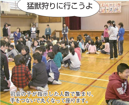
司会の子が指示した人数で集まり、 手をつないで丸くなって座ります。