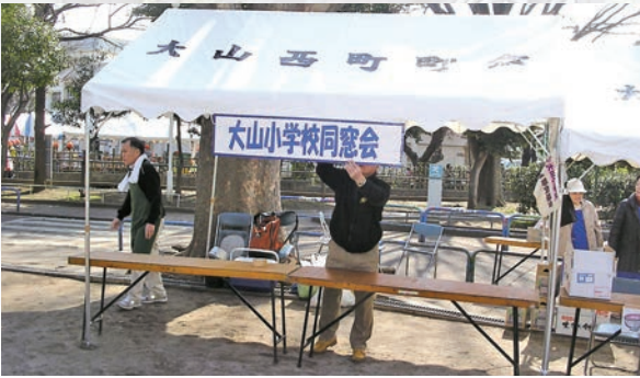
準備をする同窓生メンバー

同窓会が家庭科室でカレーライスを作るのは2回目です、10年前の大山小学校50周年の年のバザーの時から初回でした。そして20年前の40周年の時はこの家庭科室でPTAが鼓笛隊