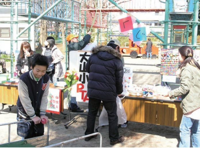
PTA、卒業生も桜まつりに参加。大人気のコーナー

大山小学校は防災のための耐震構造工事も完了し、独立した体育館も完備、校庭も広く、学童保育やアイキッズも行われている、安全で緑豊かな美しい小学校です。桜まつりの前日、カレーライスの材料を3階の家庭科室まで運ぶ作業をしていると、校庭開放で学校に遊びに来た在校生が重いお米を一生懸命両手に抱え、私達の手伝いをしてくれました。「明日のカレーライス楽しみにしてるね」と可愛い笑顔に、大山小学校には優し