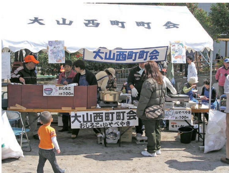
おしるこ、いそべやきのコーナー

今年の仲町地区桜まつりは近年最高の人出となりました。小春日和の交通公園と大山小学校の校庭では数々の催しが行われ、ほころび始めたさくらの美しさを再認識した一日となりました。また各町会の心こもった出店をはじめイベントがたくさんありました。わが西町町会もおしるこ、いそべやきで参加。たくさんのお客さんに喜ばれました。お手伝いいただいた方々本当にありがとうございました。なお、今回は大山小学校の寺子屋運営委員、PTA、同窓会の方々も参加し、大山小学校のアピールをしました。